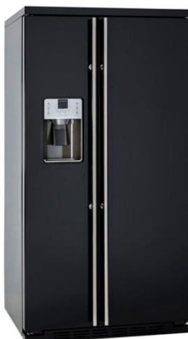
Independiente completamente en negro RAL 9005 ORGS2DFF6B