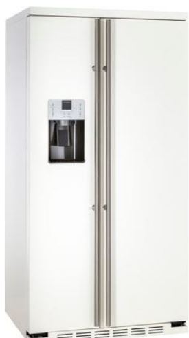
Independiente completamente en blanco RAL 9010 ORGS2DFF6W