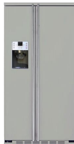
Independiente completamente RAL color a elegir ORGS2DFF6RAL