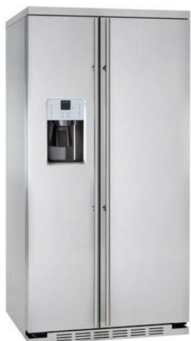
Independiente completamente en acero inoxidable ORGS2DFF60