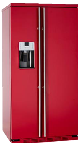
Independiente completamente en rojo RAL 3003 ORGS2DFF6R