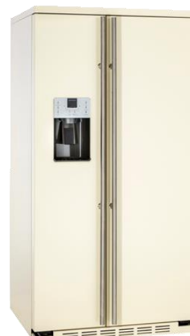
Independiente completamente en crema RAL 1015 ORGS2DFF6C